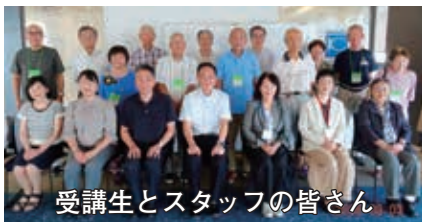
受講生とスタッフの皆さん