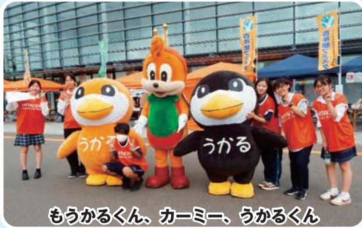
もうかるくん、カーミー、うかるくん

第157号 発行日/2025.12.20 発行/ひたち生き生き百年塾推進本部 編集/広報チーム