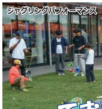
ジャグリングパフォーマンス