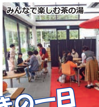
みんなで楽しむ茶の湯