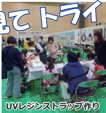
UVレジンストラップ作り