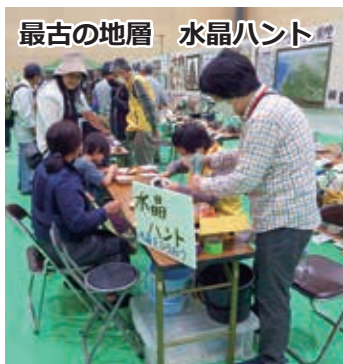
最古の地層 水晶ハント