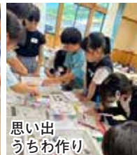
思い出うちわ作り