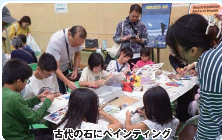
古代の石にペインティング