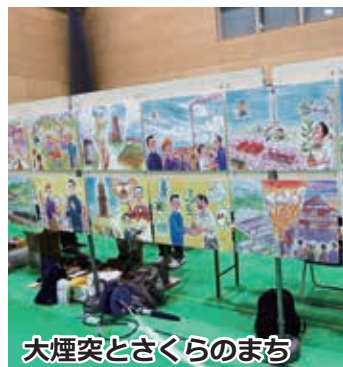
大煙突とさくらのまち