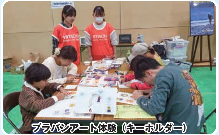
プラバンアート体験 (キーホルダー)