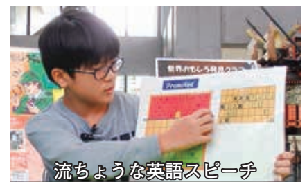
流ちょうな英語スピーチ

アトリウムでは、発見クラブメンバーから7名の小・中学生が英語発表を披露しました。かみね動物園や、学校の日、折り紙、将棋、近所の猫たち、まちのコイン、名探偵コナンなど、様々な日本の文化や日常の暮らしを、フリップを使って英語で説明しました。スピーチ内容は自分たちで考えたも