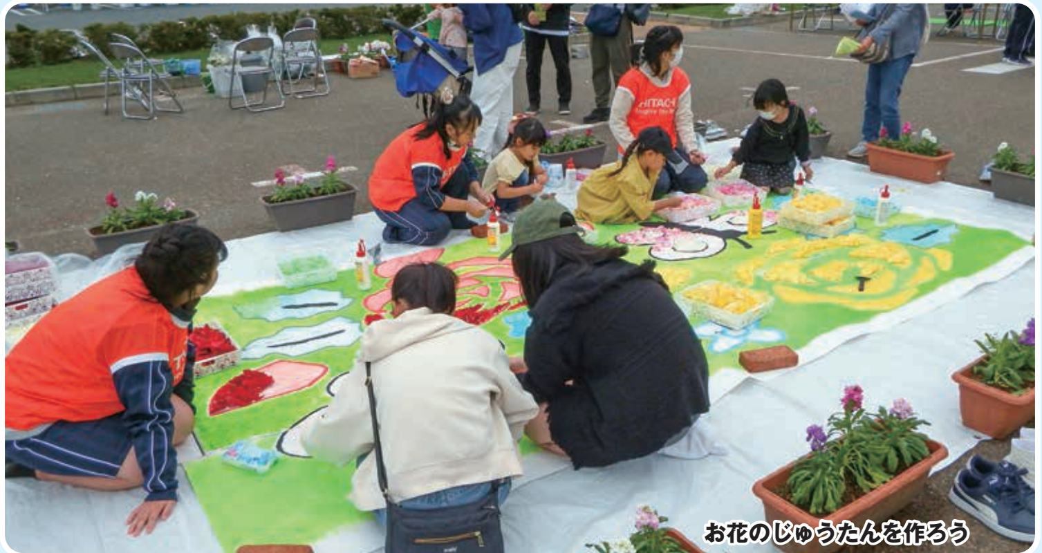
お花のじゅうたんを作ろう