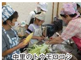
中里のトウモロコシ

「他の学校の人達と友達になり、料理や工作を一緒にできてとても楽しかった」と子ども達の笑顔がはじけました。