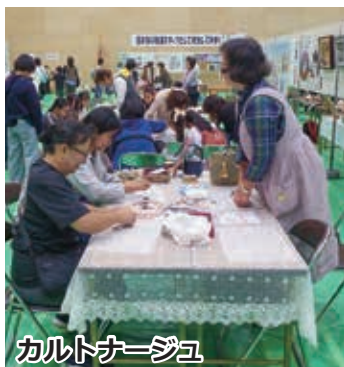
カルトナーージュ