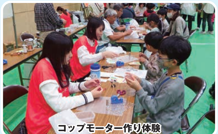
コップモーター作り体験