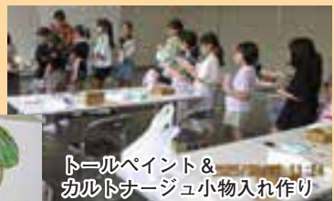
トールペイント&カルトナージュ小物入れ作り