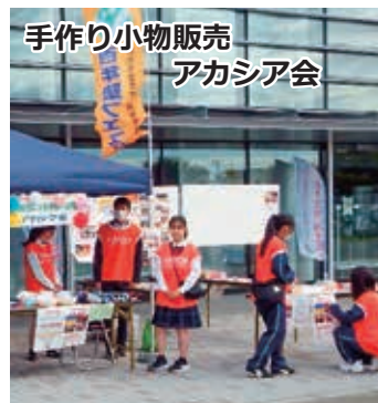
手作り小物販売 アカシア会