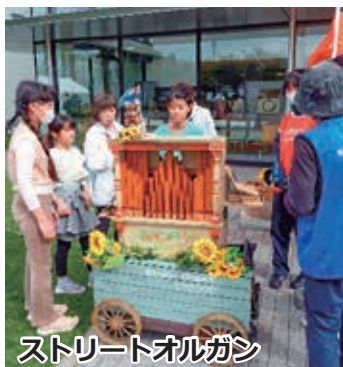
ストリートオルガン