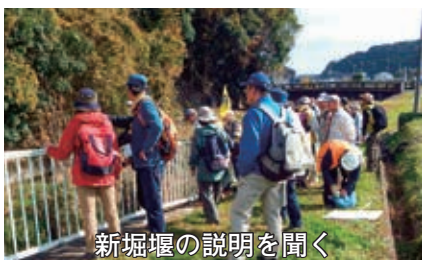
新堀堰の説明を聞く

当日は絶好の晴天に恵まれ、参加者とスタッフあわせて31名が、地層の変化と秋の自然を満喫しました。最初に十王支所周辺で楢形炭鉱の歴史と、自然の恵みを活かした先人の知恵と技について学び跡地の一部を確認。その後、五重の塔で知られる法鷲院を経て、十