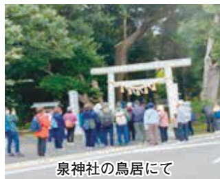
泉神社の鳥居にて

日立市内には、由緒ある寺社が多数あります。今回は、全国的にパワースポットとして有名な泉神社・大甕神社・御岩神社を巡り、由来や建造物などの説明を受けました。