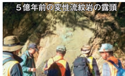
5億年前の変性流紋岩の露頭

いることも説明を受けました。さらに、川の中に点在する丸い花崗岩が上流の白亜紀の地層から流れてきたものであるという説明に、皆興味津々。十王ダムの芝生広場では昼食をとりながら、対岸に見える5億年前の変性花崗岩の大露頭を観察しました。ここで折り返した復路では川尻川発電所