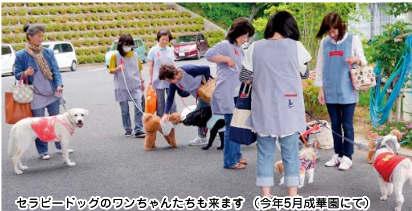
セラピードッグのワンちゃんたちも来ます (今年5月成華園にて)