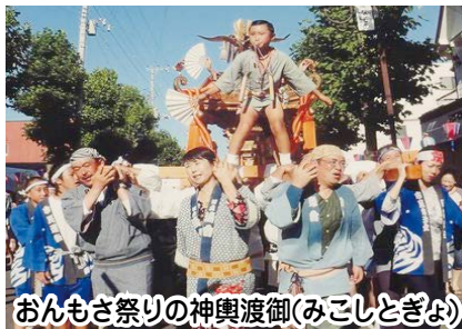
おんもさ祭りの神輿渡御(みこしとぎよ)