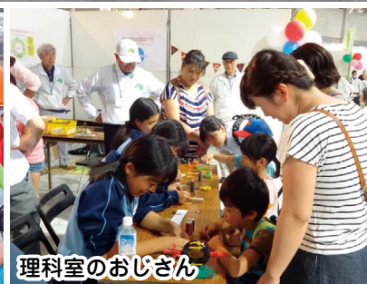
理科室のおじさん