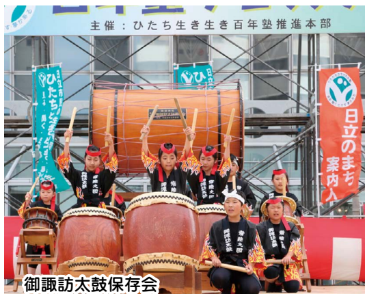
主催：ひたち生き生き百年塾推進本部