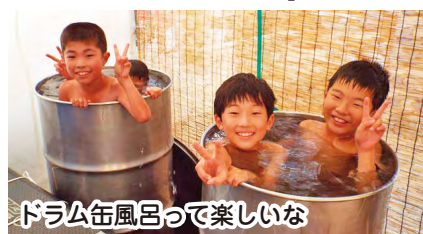
ドラム缶風呂って楽しいな

ガンに多くの行事を実施しています。最大のイベントは夏まつりで、昨夏は30回目にあたり盆踊りや6つの子供みこしパレード、1200人が参加した抽選会などが盛大に行