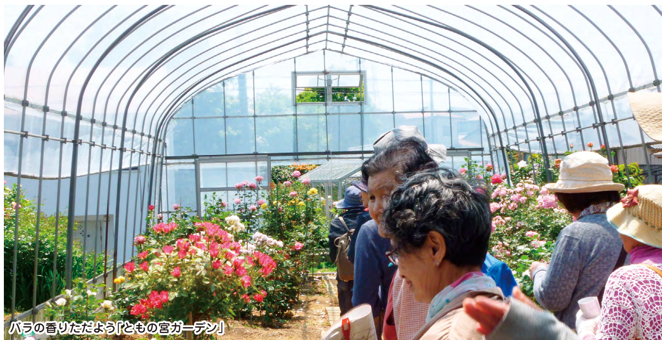
バラの香りただよ「とも宮ガーデン」