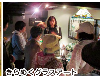
きらめくガラスアート