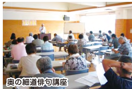
奥の細道俳句講座

平成22年度から始めた「コミュニティ連携講座」は、百年塾から提案した「講座メニュー」の中からコミュニティで希望の講座を開催しています。平成27年度は12のコミュニティで13講座が開催されました。内容は国際文化、生活