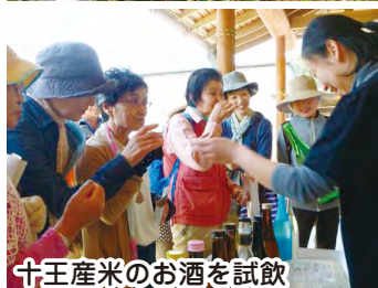
十王産米のお酒を試飲