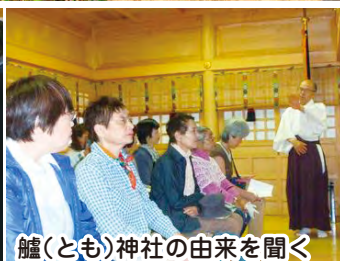
鱸(とも)神社の由来を聞く