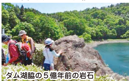
ダム湖脇の5億年前の岩石

十王町は平成16年に日立市と合併、14～15世紀には城下町・門前町・宿場町として栄えた歴史ある町でもあります。新緑溢れる5月8日、百年塾と茨城県北ジオパーク・ジオネット日立との共催で「ジオツ